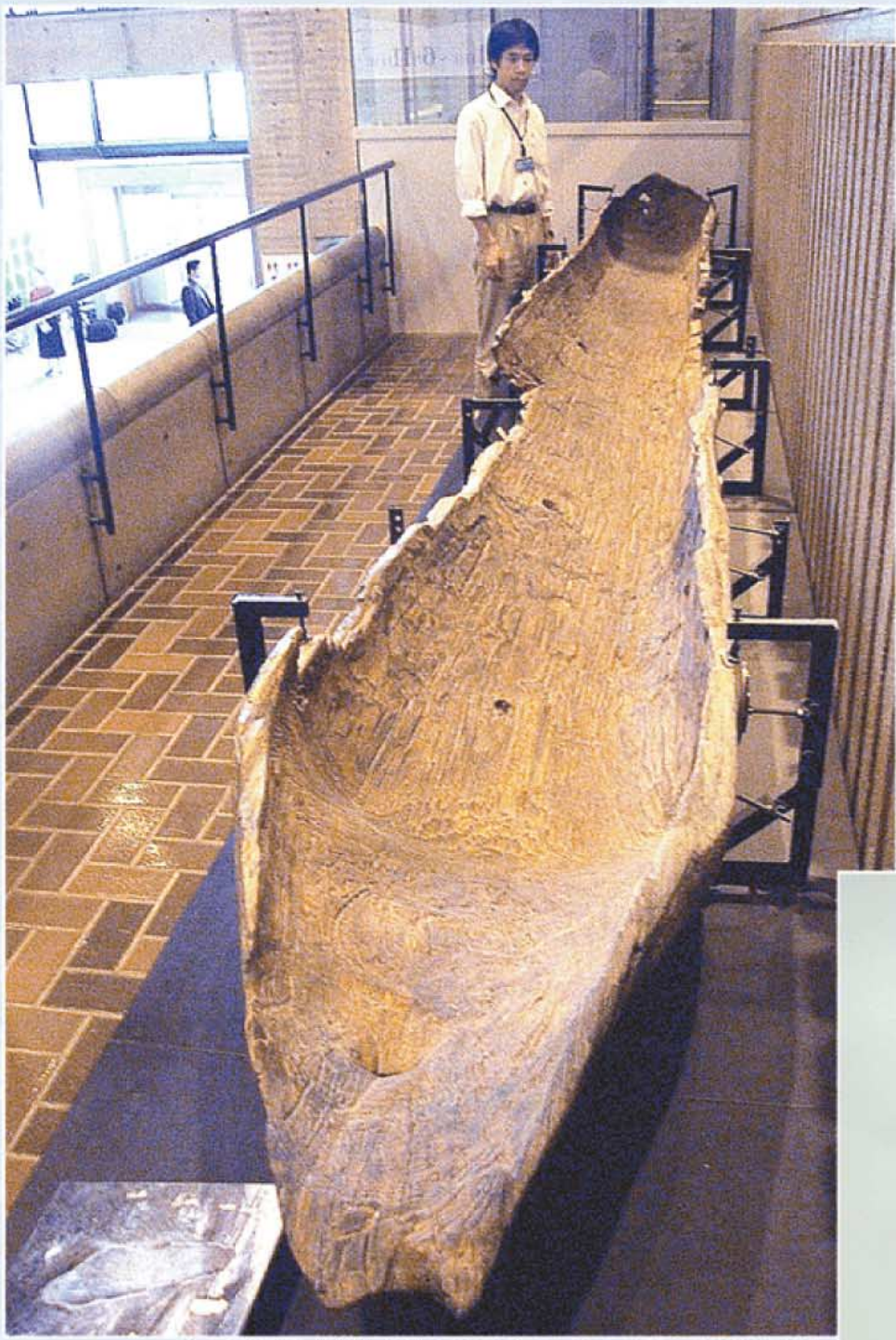
①鳥取県立博物館内にある巨大な丸木舟（県保護文化財、県教育委員会所蔵）。別の場所に同じ桂見出土の平底の丸木舟も展示してある