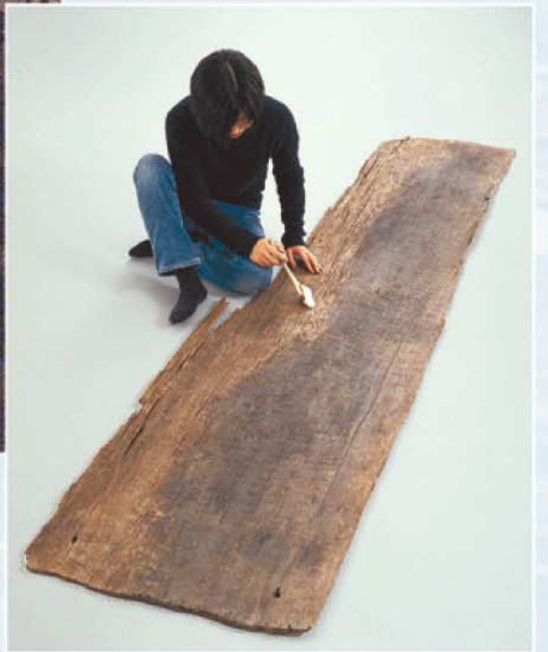
②青谷上寺地遺跡から出土した弥生時代最大の板。護岸材に使用されていたが、元は建物の部材と推定されている