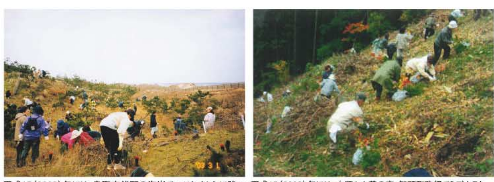
平成15(2003)年には、鳥取市伏野の海岸でマツクイムシに強い抵抗性クロマツを400本植えました。平成15(2003)年には、水源かん養の森・智頭町駒蹄でミスナとオキノヤマスギを各250本植えました。毎年下刈り作業を行っています。

そのきっかけは、平成6(1994)年に起こった猛暑による異常渇水。鳥取は千代川のおかげで断水や給水の制限がなかったのですが、それは川の上流にある森林のおかげだと気づいたのです。それから、下流域で暮らす鳥取市の女性たちは、森の大切さを学び、少しずつですが「自分たちの森があればいい。」との夢を育んできました。そして、鳥取市桂見にある「森林公園とっとり出会いの森」の一面の小高い丘を開伐したり、植樹を続けたりした結果、全国でも珍しい「女性の森」を誕生させました。今では、森林アドバイザーの指導のもと、鳥取市民の憩いの森として維持管理されています。