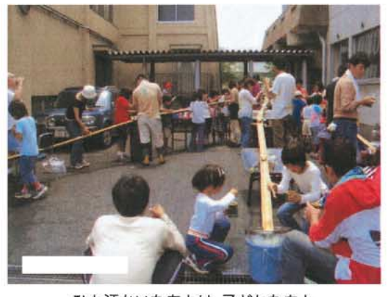
ひと汗かいたあとは、子どもたちと一緒にソーメン流しでホットひと息。