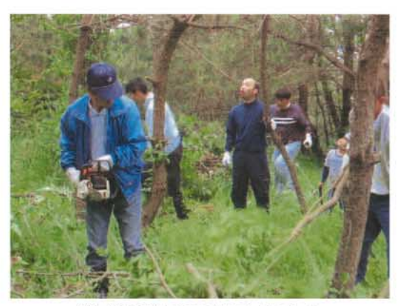
公民館の隣にある森のなかに入る「賀露のおやじ」たち。

鳥取港に臨むまち、賀露に住む愛すべき“おやじ”たちが結成。ふるさとを愛し、心豊かな子どもたちを育てたい。そんな思いから、子どもたちや地域住民と一緒に、ボランティア活動を行っています。そのひとつが、付近を流れる千代川の源流、智頭に住む方々との交流。山村に暮らす人々とともに汗を流しながら、間伐などの作業を学んでいます。海と山。離れていてもつながっているのが自然。それと同じように、それぞれの地域に暮らす人々も強く結ばれ、交流の輪も確実にひろがっています。