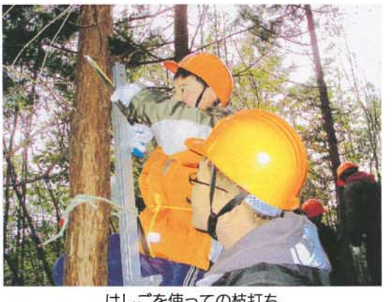
はしごを使っての枝打ち。海の子どもたちにとって、はじめての体験です。